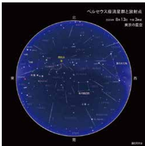
武雄市の日の出 8月12日3時39分 8月13日3時40分

三大流星群の一つであるペルセウス座流星群が見ごろを迎えます。12日深夜から13日未明にかけて、多くの流星が見られそうです。21時頃から流星が出現し始め、夜半を過ぎて薄明に近づくにつれて流星の数が増えると予想されます。最も多く流星が見られるのは、13日の夜明け近くと考えられます。この前日にあたる12日と、この翌日にあたる14日の夜明け近くにも多めに流れることが予想されます。