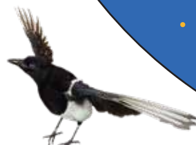
カササギ (カチガラス)

現在の暦では7月7日は梅雨のまただ中です。月の満ち欠けを基にした昔の暦(太陰太陽暦、旧暦)によれば、今年の7月7日は8月10日。旧暦の七夕は近年「伝統的七夕」と呼ばれ、お祭りなどはこの日に行われることが多いようです。晴れた夜空で夏の大三角、七夕の星々を探してみてください。