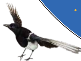
カササギ (カチガラス)

7月7日は現在の暦では梅雨のまっただ中です。月の満ち欠けを基にした昔の暦(太陰太陽暦、旧暦)によれば、今年の7月7日は8月22日。旧暦の七夕は近年「伝統的七夕」と呼ばれお祭りなどはこの日に行われることが多いようです。梅雨も明け晴れた夜空で夏の三大角、七夕の星々を探してみてください。